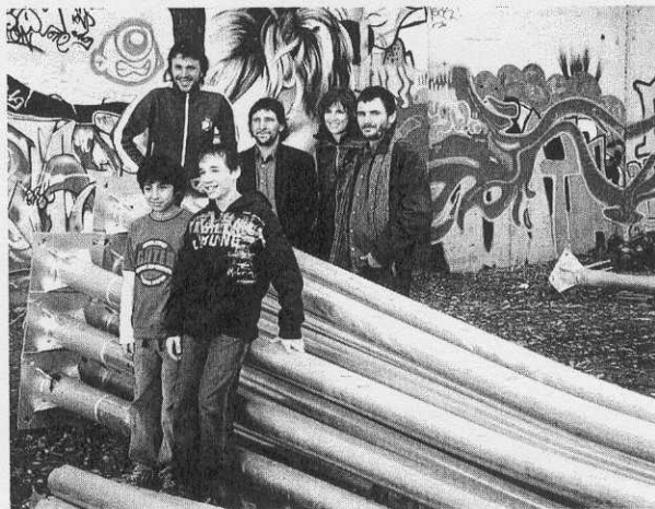
El elenco al completo con los niños que dan vida a las víctimas

Todo empieza con el tiroteo en el interior de una peluquería, en el que muere un niño, tras el que los autores huyen por el desierto esperando que el asunto se olvide. Muchas vivencias pe-